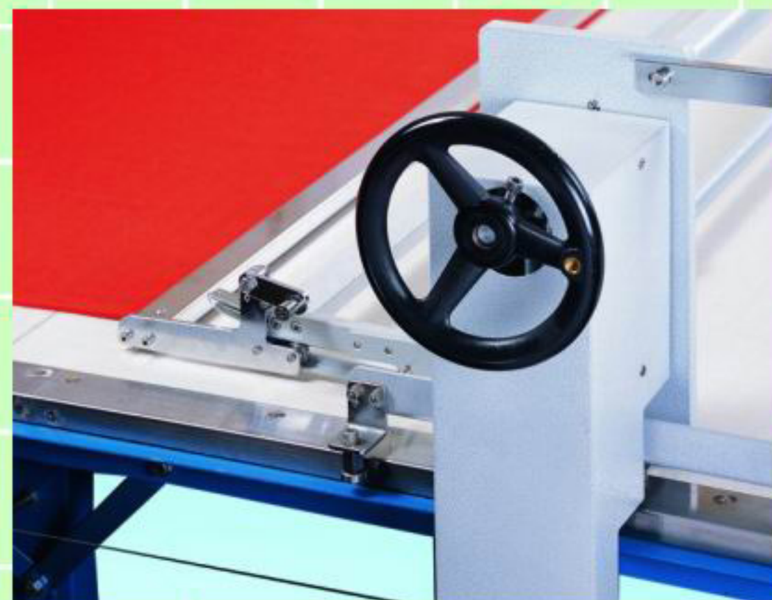
One side quick lock movable catcher